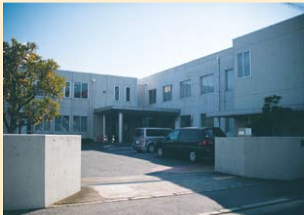
【市川簡易裁判所・千葉家庭裁判所市川出張所】

我々が、第9回首都圏弁護士会支部サミットin船橋の開催テーマを決定するにあたっては、地域の実情と裁判所の機能等を分析して、支部サミットを通じて我々はどのようなことができるのかを考えました(第7号)。その上で、千葉県に設置されている各裁判所の管轄内人口等を調査して(第8号)、地域の問題点を浮き彫りにし、問題点については皆様のご意見を踏まえつつ議論を重ねて、司法サービスの充実を図って行きたいと考えております。