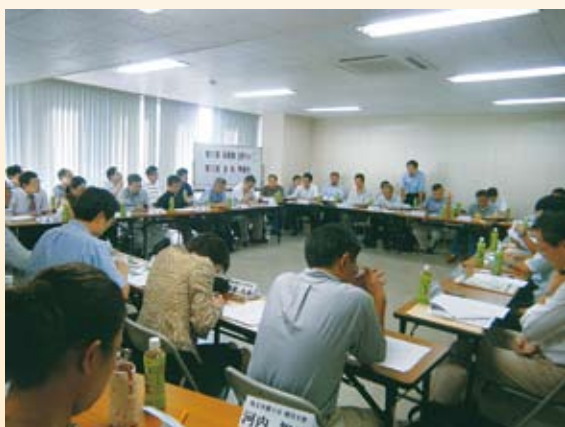
<平成23年9月10日 第3回全体準備会の様子>

本年9月10日（土）に、11の弁護士会支部及び2つの弁護士会本部から46名の弁護士が参加して第9回首都圏弁護士会支部サミット第3回全体準備会が行われました。