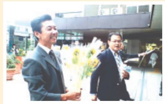
〈平成19年10月JR船橋駅前でのひまわり配りの様子〉

京葉支部の広報活動を企画・運営しています。京葉支部では、ホームページの作成や市役所のバナー広告、タウンページへの掲載等、様々な広報活動を行っています。また、船橋市民まつりへの参加やJR船橋駅前でのひまわり配り等、市民の皆様へ京葉支部の存在を知っていただくため、積極的に広報活動を実施しています。