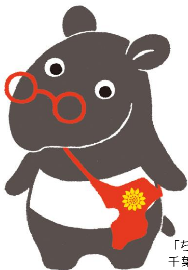
「ちーべん」は 千葉県弁護士会の キャラクターです。