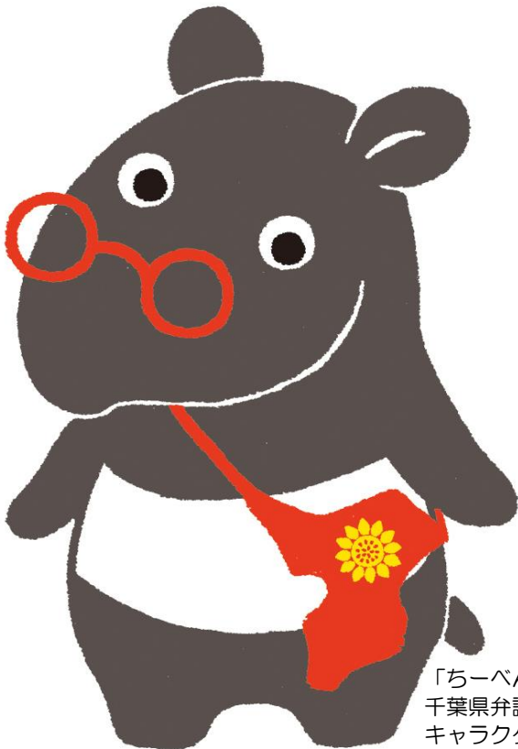
「ちーべん」は 千葉県弁護士会の キャラクターです。