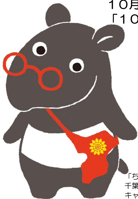
「ちーべん」は 千葉県弁護士会の キャラクターです。