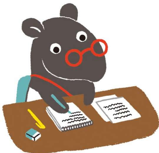
「ちーべん」は千葉県弁護士会のキャラクターです。