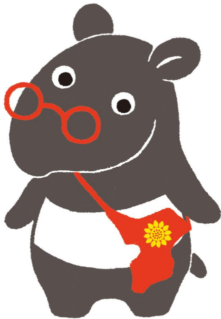
「ちーべん」は千葉県弁護士会のキャラクターです。